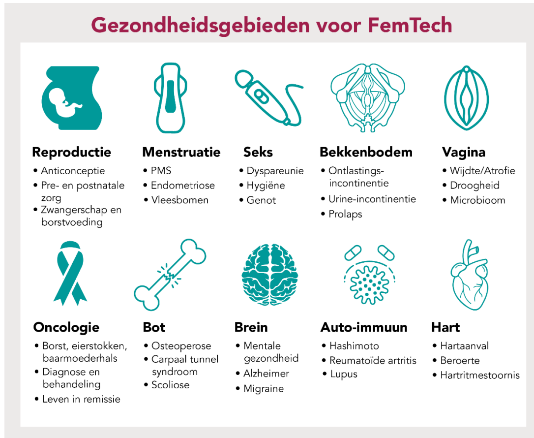
Figuur 2 Toepassingsgebieden

Bron: Rathenau Instituut. Gebaseerd op: Barreto et al. 2021., p. 4.